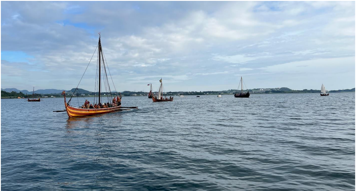
Helge Ask og andre vikingskip ankommer Hafrsfjord den 16.6.2022.